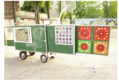
Ecole mobile GPAS à Varsovie, Pologne

Lors de chaque rencontre, les participants ont pu se rendre sur le terrain dans les différents quartiers de la ville où interviennent les professionnels polonais.